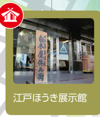
江戸ほうじ展示館