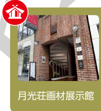
月光荘画材展示館