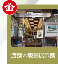
渡邊木版画展示館

月光荘画材展示館の地下にこの4月にオープン。「現代の茶室」をコンセプトとして、東西の文化が絶妙に調和するカフェ。奥には画室があります。